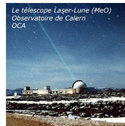
Le télescope Laser-Lune (MeO) Observatoire de Calern OCA

En 1960, Théodore Maiman, obtient le premier laser, dont le principe de base était déjà décrit par Albert Einstein en 1917. Depuis, son utilisation et ses applications n'ont cessé de se développer : transfert d'information, procédé industriel, applications militaires, médicales, scientifique. Aujourd'hui, par exemple, un laser est tiré sur la Lune depuis l'observatoire de Calern, dans l'arrière pays grassois, afin de mesurer à quelques centimètres près la distance Terre-Lune !